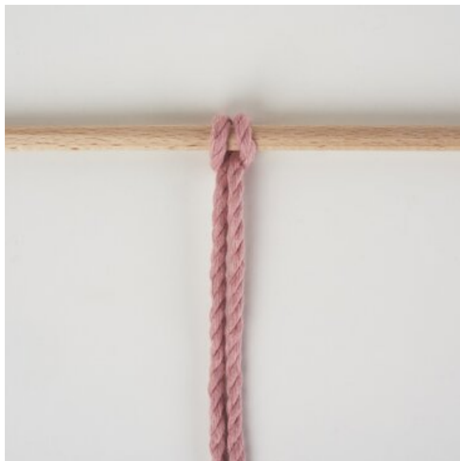
Nodo della testa di Lark all'indietro