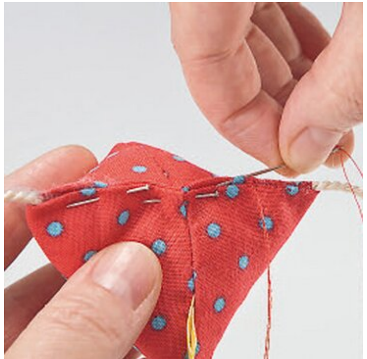
Cucire le gambe