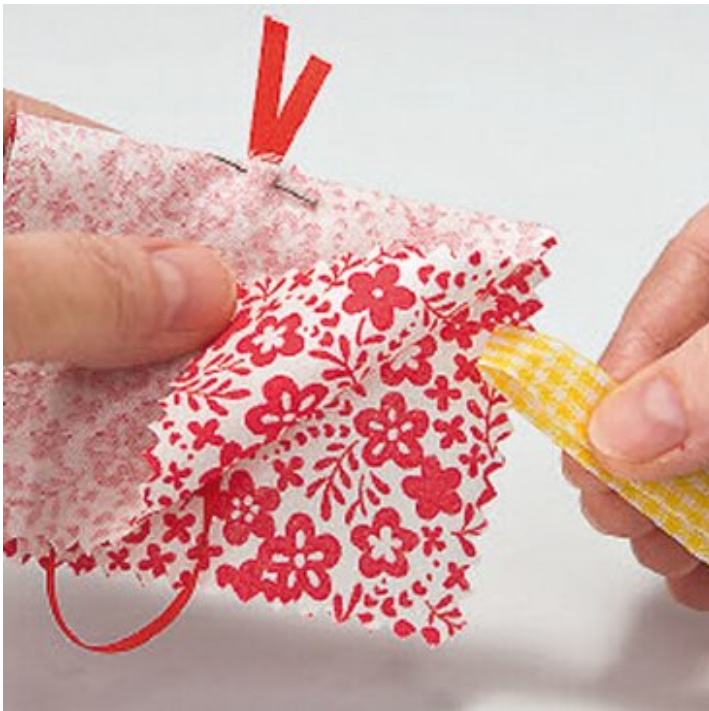
Inserire il becco

Per una migliore tenuta, cucire di nuovo attraverso il centro del corpo e cucire in basso. Infine, cucire le rocailles come occhi.