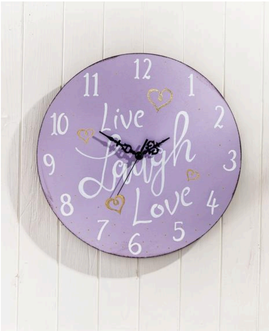
Sui piccoli mobili