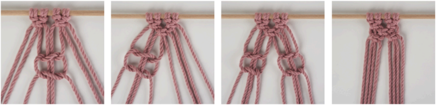
Fila 7 - 8 = nodi a coste orizzontali