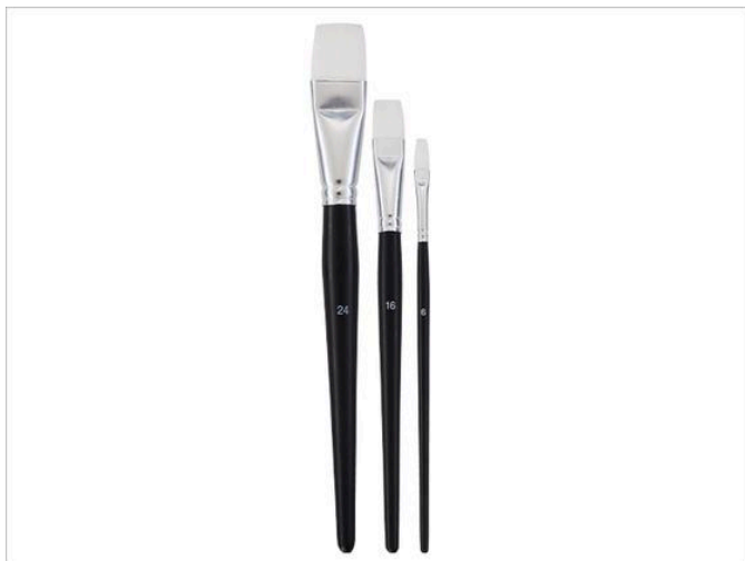
Spazzola per tovaglioli

Oltre all' oggetto desiderato , vi serviranno un tovagliolo con un motivo a scelta, un pennello per tovaglioli , una pinzetta , delle forbici e i colori e la colla per tovaglioli adatti a questa tecnica artigianale.