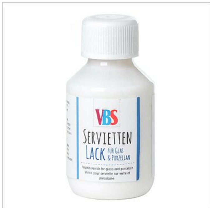
Vernice per tovaglioli