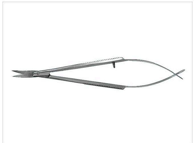
Forbici a pinzetta