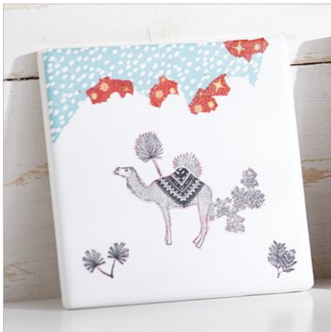
Esempio di decorazione