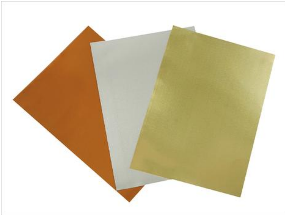
Foglio per goffratura