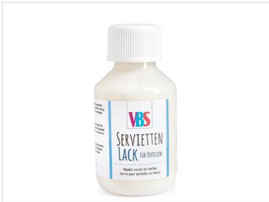
Vernice per tovaglioli Tessili