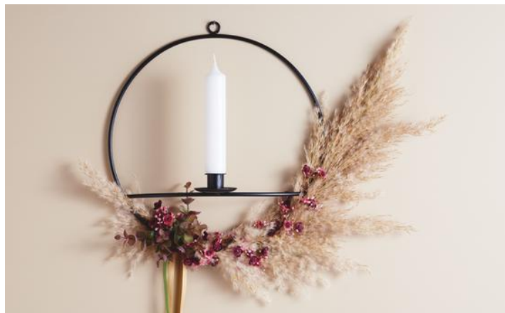
Anello decorativo nero con candela