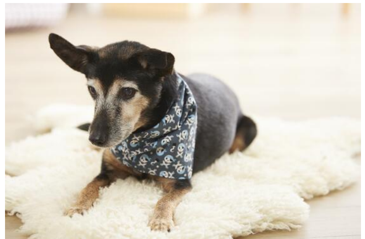
Sciarpa per cani